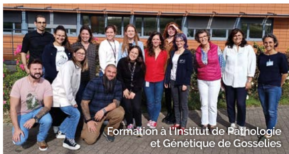
Formation à l'Institut de Pathologie et Génétique de Gosselies