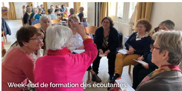
Week-end de formation des écoutantes

Agapa, c'est aussi la formation : l'équipe de formatrices est un formidable moteur et nous avons à cœur de répondre aux besoins de nos bénéficiaires avec le développement de nouveaux modules.